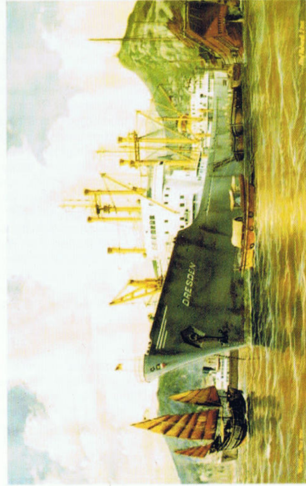
MS „Dresden“ in Tsingtao, März 1959, Marinemaler Olaf Rahard